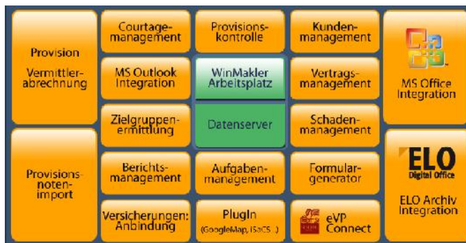
Programmstruktur von WinMakler Professional

WinMakler ist bei vielen Maklern in Österreich seit Jahren erfolgreich im Einsatz.